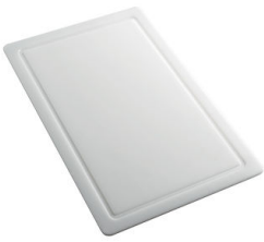
Planche de découpe en HDPE 8657 001